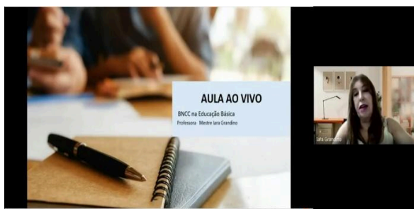
Figura 1. Formação sobre a BNCC

São realizadas constantes formações na Área de Formação de Professores e nesse ano de 2025, iniciamos com o tema da Base Nacional Comum Curricular (BNCC) e o novo Formato do ENADE (Exame Nacional de Desempenho dos Estudantes), conforme demonstram figuras 1 e 2: