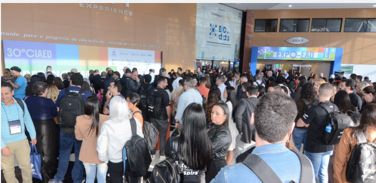
Imagen del 30° CIAED