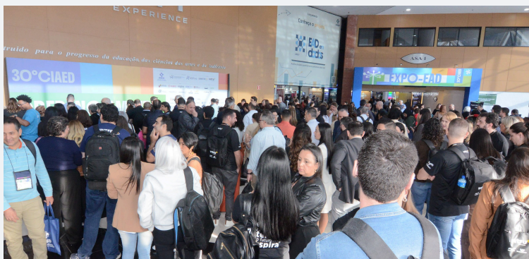
Imagen del 30° CIAED