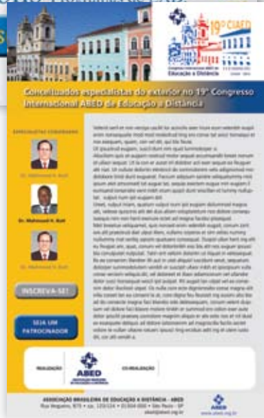
E-MAIL MARKETING DE DIVULGACIÓN DE LA CONFERENCIA