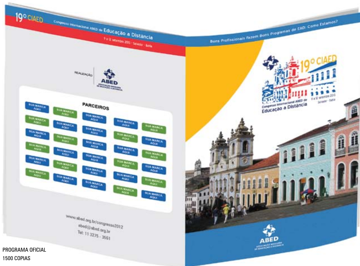
PROGRAMA OFICIAL 1500 COPIAS