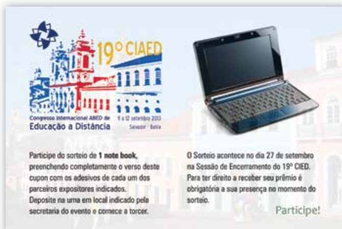
TARJETA PARA EL SORTEO