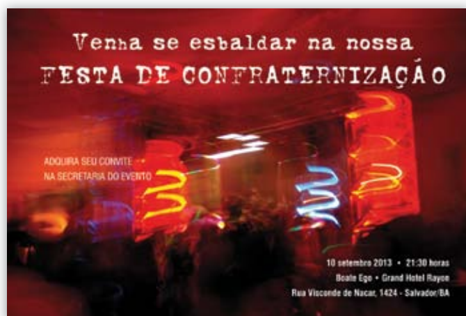
INVITACIÓN PARA FIESTA

SOLICITE SUA ETIQUETA NOS ESTANDES DOS PARCEIROS EXPOSITORES E BOA SORTE!