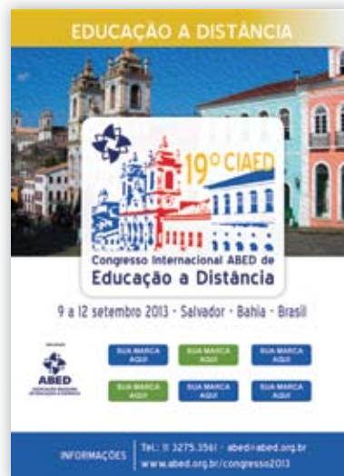
ANUNCIO EN PUBLICACIONES DE PATROCINADORES