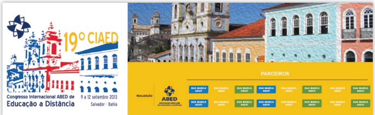
PANCARTA DE MESAS