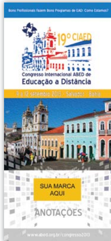
BLOCO DE ANOTACIONES