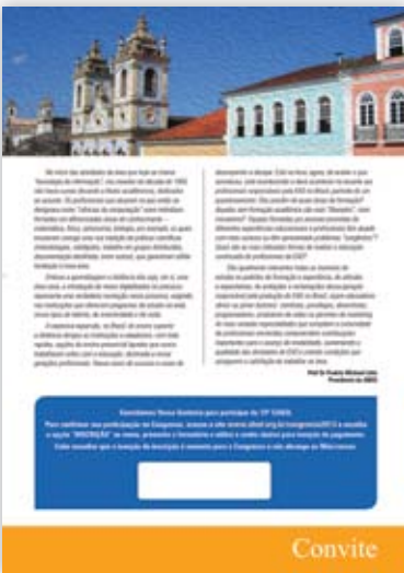
INVITACIÓN CONTRASEÑA INSCRIPCIÓN GRATUITA