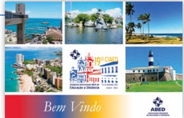
TARJETA DE BIENVENIDAS