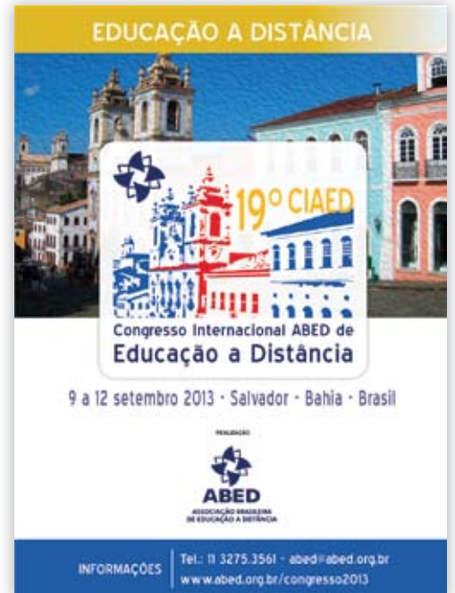
CARTELES DE DIVULGACIÓN EN UNIVERSIDADES