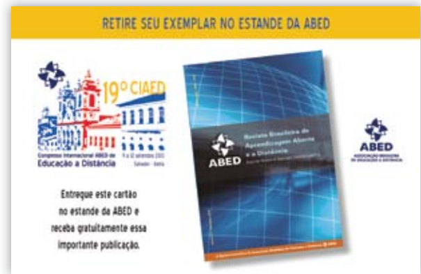
TARJETA PARA RETIRADA DE LIVROS