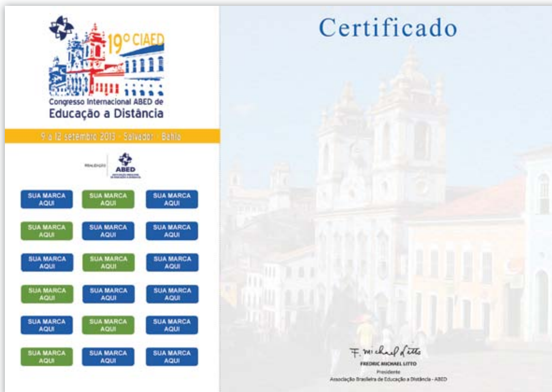
CERTIFICADO DE PARTICIPACIÓN