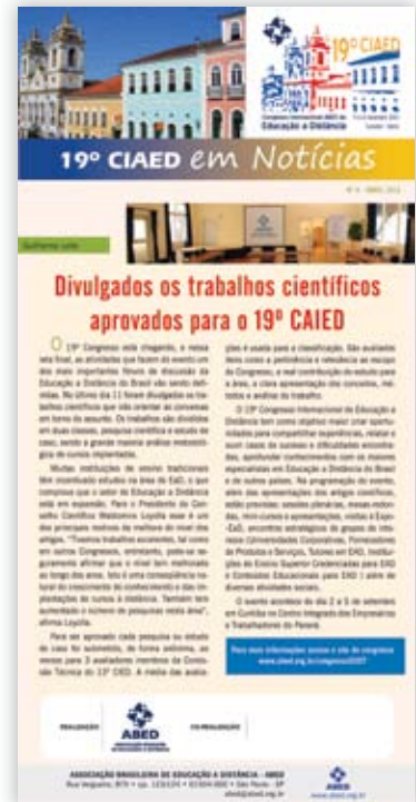
E-NOTICIAS – DIVULGACIÓN DE CONTENIDO