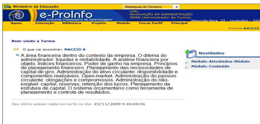
Figura 1. Plataforma e-Proinfo

A plataforma tem três áreas de trabalho: azul, na qual ficam localizadas todas as turmas do curso, incluindo as que estão sendo ofertadas e as que já foram. Essa área no menu de navegação contém a parte de apoio que tem as ferramentas de agenda, diário, estatística, notícias, referências e tira-dúvidas. Na fig. 3 verificamos a área amarela da plataforma: