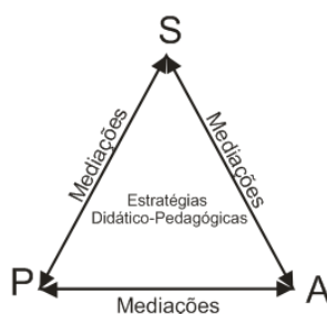
Figura 3 – Reconfigurações do Sistema Didático (OLIVEIRA, 2009)

No contexto da transposição didática, então, a centralidade das estratégias, os papéis das pessoas (professores e alunos) e o sentido múltiplo dos fluxos de construção do conhecimento parecem permitir outra visão do esquema original de CHEVALLARD (1991, p.23), no que se refere aos sistemas didáticos: