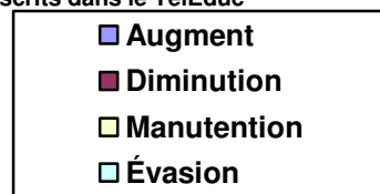
Graphique 2: Pourcentage de la performance des Mentions des élèves dans l'EVA en 2005

De la même manière, en octobre 2006, après plus d'une année d'utilisation d'EVA, 55 élèves ont répondu à Enquête intitulé «Élève on-line - apprentissage et participation à l'environnement TelEduc», avec la suivante question: «Pour toi, quel est l'élément ou l'outil qui favorise plus grand apprentissage et participation dans l'environnement virtuel d'apprentissage –