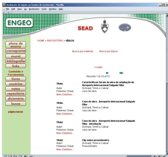
Figura 4: lista de registros encontrados para busca por vídeos.