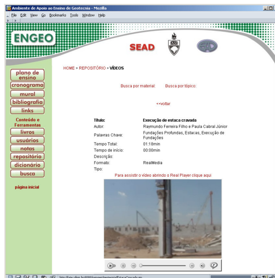
Figura 5: página que mostra detalhes descritivos do vídeos bem como o próprio vídeo.

Os detalhes já mencionados a respeito de buscas valem para todos recursos educacionais do ROE. Além disso, tem-se a disposição do aluno um dicionário inglês/português de expressões técnicas da área da Engenharia Geotécnica e dois livros eletrônicos sobre patologia das fundações e sobre ensaios de campo, sendo que estes recursos são acessados pelos respectivos links do índice principal.