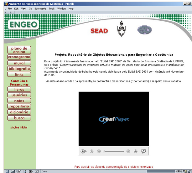
Figura 2: tela inicial do sistema ENGEIO

Neste índice o usuário tem acesso às informações da disciplina a partir do primeiro grupo de botões na parte superior, como plano de ensino, cronograma, mural de informações, bibliografia recomendada, links para sites WEB referentes ao domínio. No segundo grupo de botões tem-se acesso à ferramentas e conteúdos para usuários do sistema, sendo eles, livros, lista de usuários e seus endereços de e-mail, notas atribuídas às atividades da disciplina para cada aluno, repositório de objetos educacionais, dicionário de termos técnicos de geotecnia e sistema de busca de conteúdo.