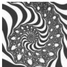
Figura 2 – Expressão gráfica do modelo de desenvolvimento de design instrucional contextualizado

Conforme WILLIS & WRIGHT (2000), nesse modelo, o foco é inicialmente difuso e se torna mais nítido e distinto à medida que a implementação da proposta evolui. Esse caráter recursivo e dinâmico é possibilitado pela seleção de ambientes tecnológicos de desenvolvimento que suportem os recursos de autoria, flexibilidade e acessibilidade.