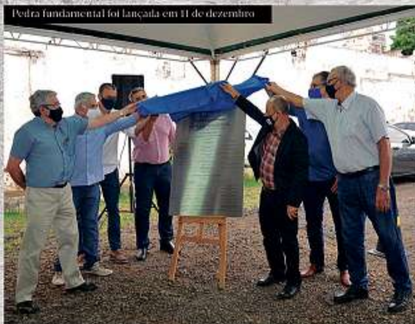
Pedra fundamental foi lançada em 11 de dezembro