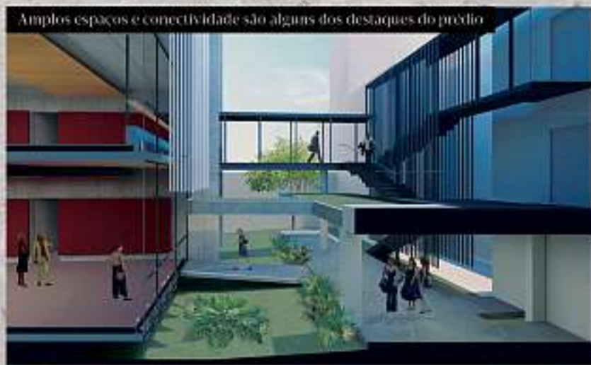
Amplios espaços e conectividade são alguns dos destaques do prédio