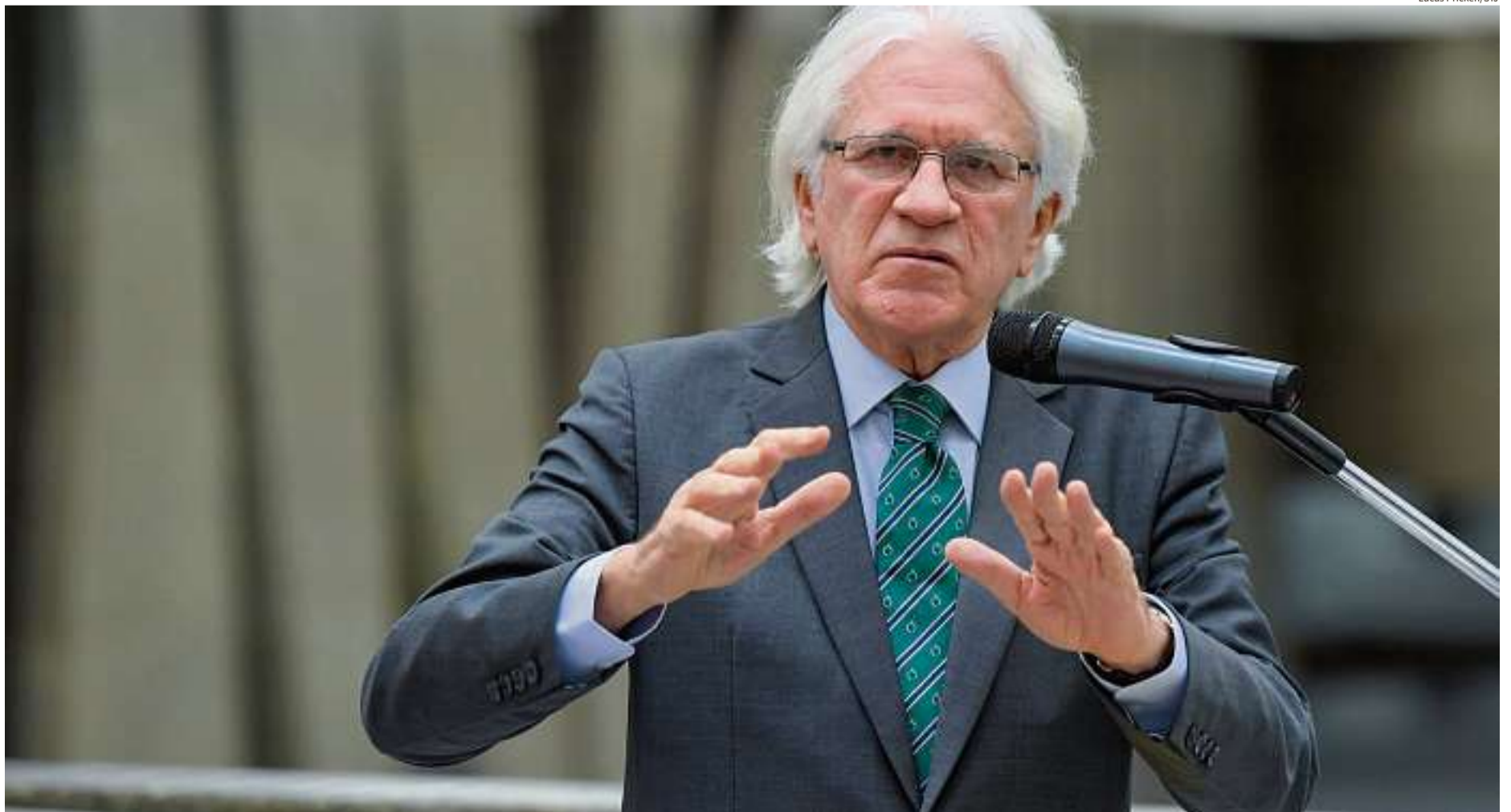
Filho de Napoleão só obteve a carteira da OAB no ano passado, mas foi aprovado pelo Congresso para o cargo de R$ 37 mil