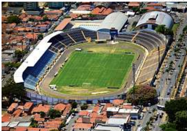
Neste primeiro momento, a meta é revitalizar o alojamento

porte. O projeto (registrado), inclusive, já foi aprovado e publicado no Diário Oficial da União no último dia 12 e está aberto para captação. A população também pode ajudar deduzindo até 6% do Imposto de Renda devido. P 10