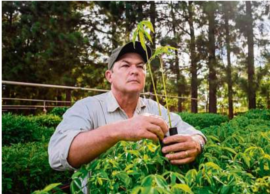
Seu projeto é reconhecido como "maior corredor já reflorestado no Brasil"

O reconhecimento é pelo projeto "Corredores para a vida", que reconecta florestas na Mata Atlântica. "Por causa do desmatamento e queimadas, hoje existem muitos espaços, buracos nas florestas, e é preciso reflorestar para que