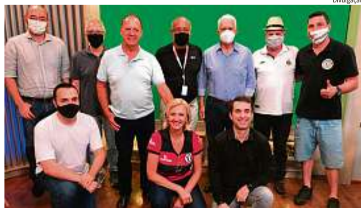
Objetivo é revitalizar e reabrir o alojamento anexo ao estádio

Para que a iniciativa seja concretizada, no entanto, os membros da diretoria do Alvinegro Piracicabano e da Asso-