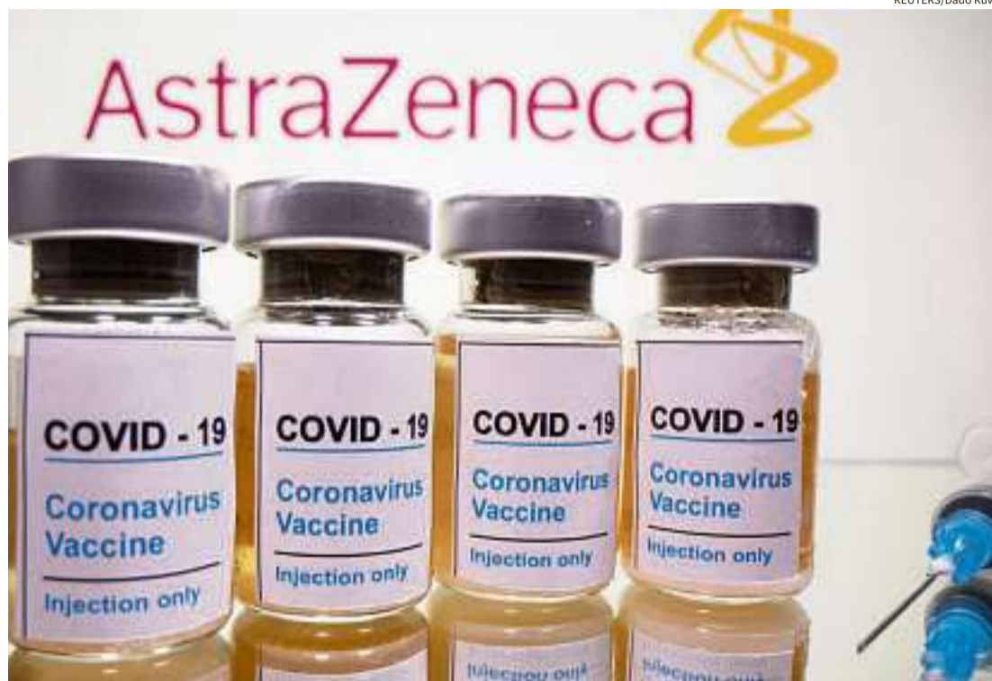
O prazo é próximo das primeiras expectativas do PNI anunciado pelo governo federal

A vacina da AstraZeneca não é a que está em está-