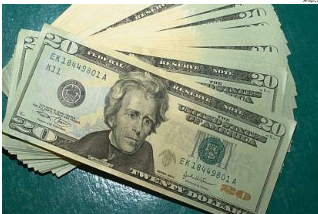
No mesmo período do ano passado, o montante havia sido de US$ 8,735 bilhões

Em um ambiente de incertezas sobre o futuro do Brasil, na esteira da pandemia da covid-19, os IDP (Investimentos Diretos no País) somaram US$ 1,514 bilhão em novembro, informou na última sexta-feira (18), o Banco Central. No mesmo período do ano passado, o montante havia sido de US$ 8,735 bilhões. O resultado ficou dentro das estimativas apuradas pelo Projeções Broadcast, que iam de US$ 1,0 bilhão a US$ 2,4 bilhões, com mediana de US$ 1,2 bilhão. Pelos cálculos do Banco Central, o IDP de novembro indicaria entrada de US$ 1,0 bilhão.