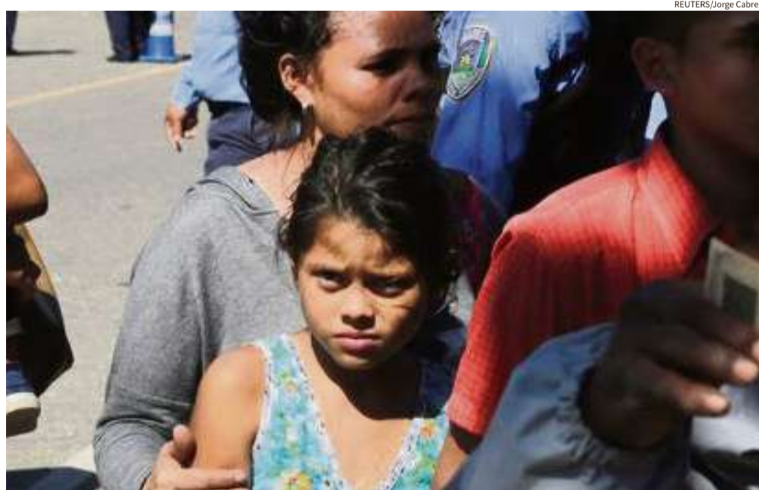
Mensagem foi divulgada pelo diretor-geral da OIM, António Vitorino

Em 2019, disse Vitorino, os migrantes foram declarados pela OIM como os “campeões da resiliência em tempos difíceis”, “sem saber como eles, e