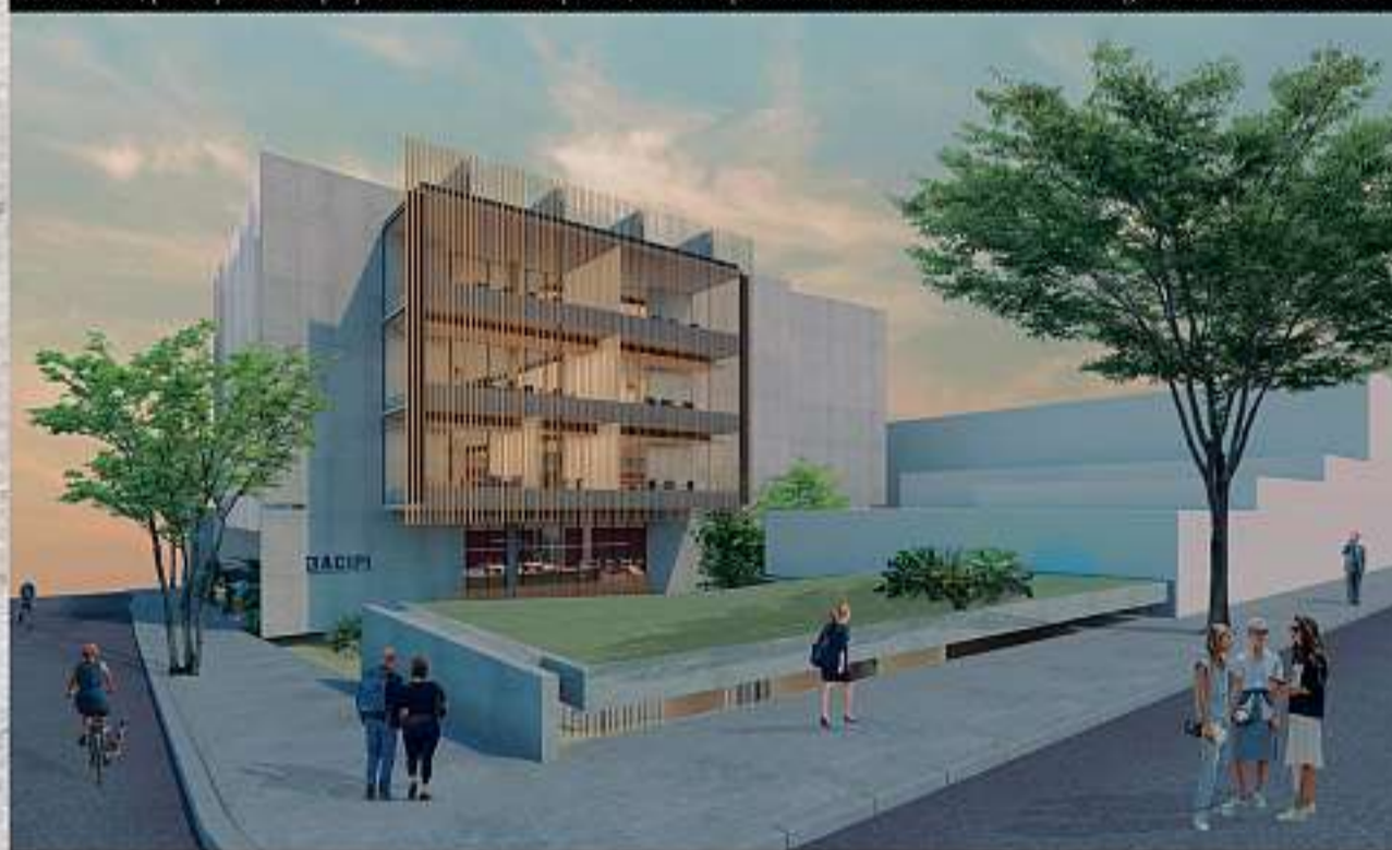
Associados, principalmente pequenas e médias empresas, terão a oportunidade e acesso a novas tecnologias com custo acessível

para atendimento ao público e mais três pavimentos para aulas práticas.